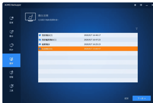
步驟3：點選還原這個系統。如果您要將系統還原到其他電腦，請勾選下方“將系統還原到其他位置”，然後點選下一步。